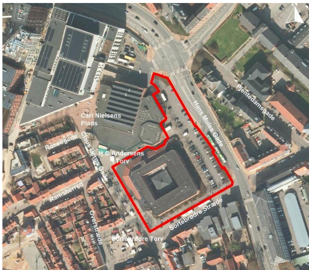
Oversigtskort. Rød afgrænsning er lokalplanområdet.

Forvaltningen vurderer, at Økonomiudvalgets tilkendegivelse er så beskeden en ændring af lokalplanen, at en ny offentlig høring af lokalplanforslaget ikke er nødvendig.