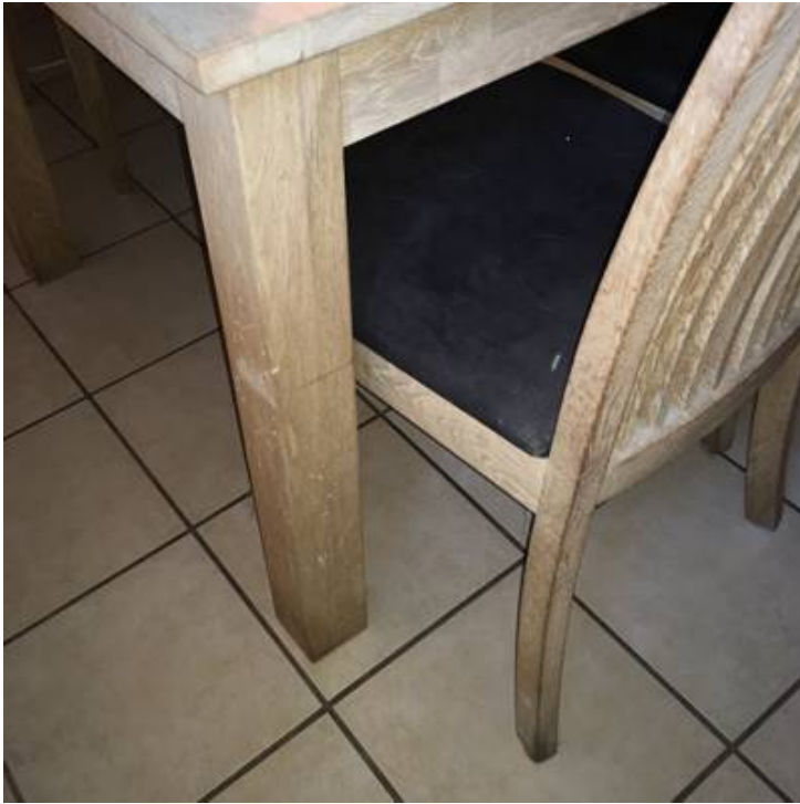
Grå/hvide aftegninger på spisebord og stol i køkken.