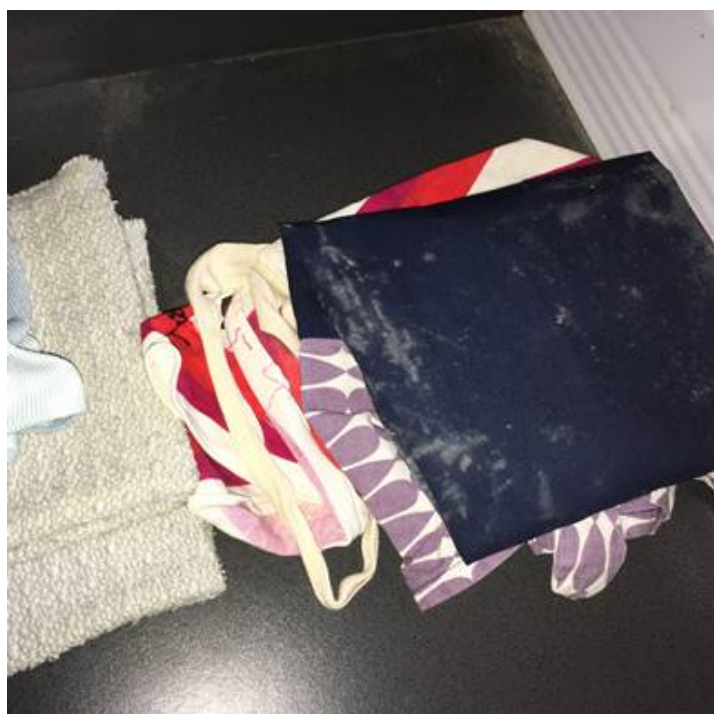
Grå/hvide aftegninger på tekstil i køkkenskuffer

Billeder fra besigtigelsen af inventar/effekter i lejligheden fremgår herunder: