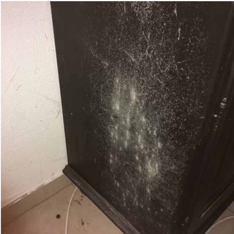
Grå/hvide aftegninger på inventar i køkken

Efter besigtigelsen er lejerne flyttet og opholder sig ikke længere i lejemålet, da de ikke længere tør opholde sig i boligen. De betaler dog stadig husleje, og betragtes derfor fortsat som lejere af boligen.