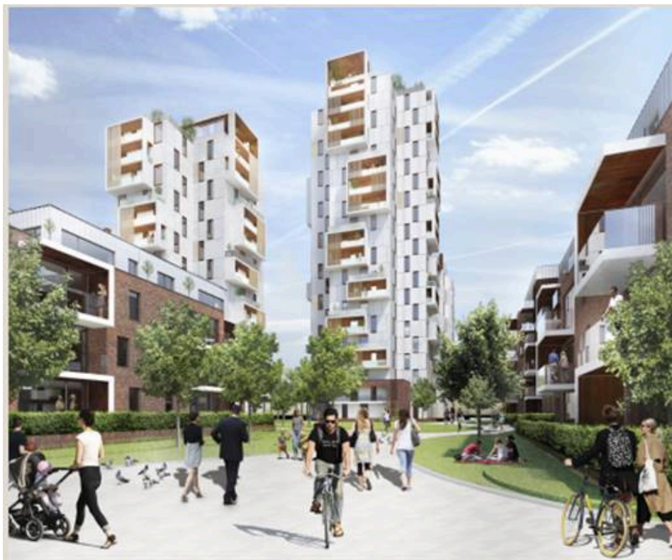
Illustration fra lokalplan – Figur 16:

Det grønne gårdrum i bebyggelsen med kig mod de to høje bygninger: