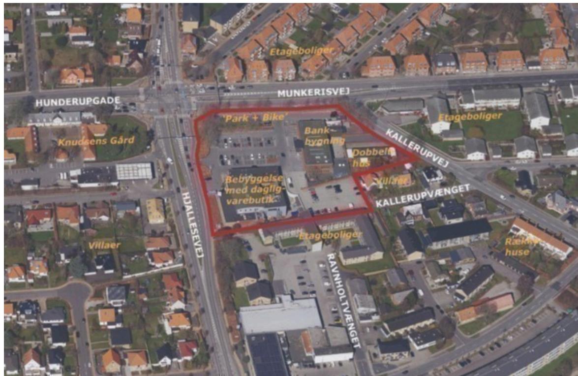
Luffoto med afgrænsning af lokalplanområdet.

Lokalplan nr. 2-1080 Bydelscenter på Munkerisvej/Hjallesevej er udarbejdet med baggrund i, at Rema 1000 ønsker at etablere en ny dagligvarebutik på ejendommen Munkerisvej 1, 5230 Odense M.