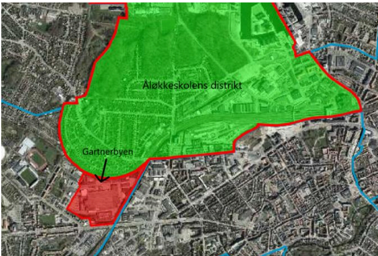
Figur 3: Åløkkeskolens distrikt inkl. Gartnerbyen, markeret med rødt (anbefalet distriktsændring)